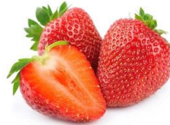
5 o 6 fresas