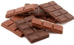
30 gr de chocolate